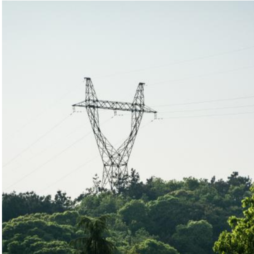
Budowa trzech jednotorowych linii napowietrznych 220 kV SS 220 kV Nishanskaya SFES-ORU 220 kV Elektrociepłownia Talimarjan