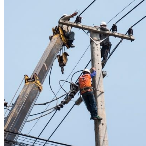
Budowa linii napowietrznej 220 kV SDTES do stacji 220 kV „Zafarobod”