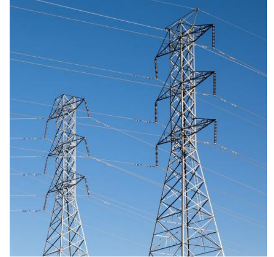
Budowa napowietrznej linii elektroenergetycznej 110 kV na farmie wiatrowej, specjalnego węzła przemysłowego, inżynierii mechanicznej i urządzeń elektrycznych w regionie Andiżan

Powyższe przykłady są jedynie wybranymi z licznych realizacji firm z Grupy RESBUD.