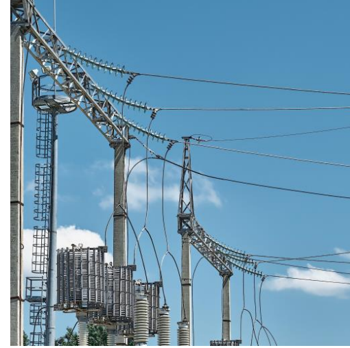
Budowa elektrociepłowni Turakurgan z linią napowietrzną 220-110 kV