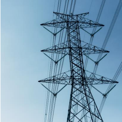
Budowa dwutorowej linii napowietrznej 220 kV od Elektrociepłowni Syrdaria do stacji Pechnaya i stacji Hutniczej