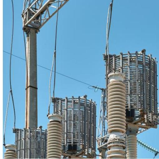
Budowa linii napowietrznej 500 kV w stacji Surkhan – podstacja Khoja – Alvan (przez terytorium Republiki Uzbekistanu)