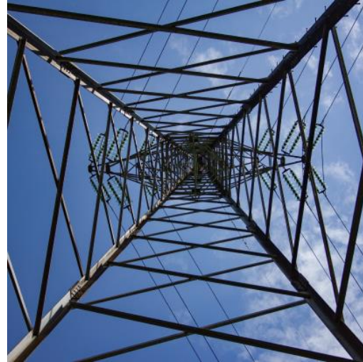
Budowa dwutorowej linii napowietrznej 110 kV w ramach projektu „Przyspieszenie budowy obiektów farm wiatrowych Tashkent Cotton Textile LLC”