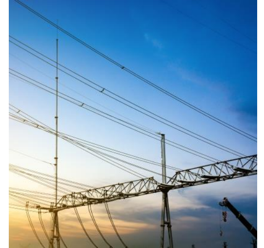
Budowa linii napowietrznej 110 kV oraz części konstrukcyjnej stacji 110/35/10 kV „Suffa” zgodnie z projektem farmy wiatrowej turystyczno-rekreacyjnej strefy „Zomin”

Powyższe przykłady są jedynie wybranymi z licznych realizacji firm z Grupy RESBUD.